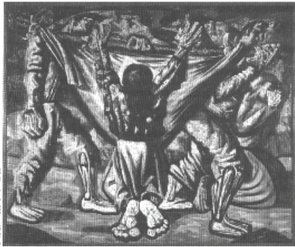
Enterro na Rede – Cândido Portinari

Observe as figuras abaixo para responder a questão 72.