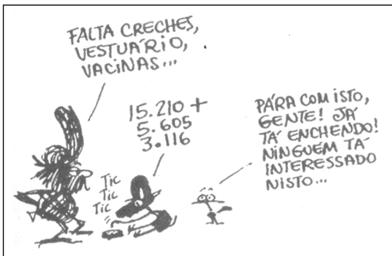
Henfil. A Volta da Graúna . 2 ed. São Paulo: geração Editorial, 1993:32.

10. Observe as falas das personagens da tira.